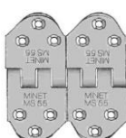
mechanický spojovač MS55