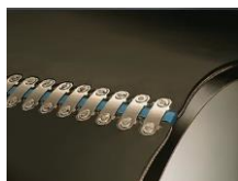
mechanické spony Flexco Bold Solid Plate