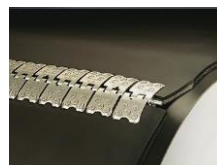
mechanické spony Flexco Rivet Hinged