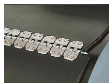
mechanické spony Flexco R2