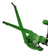
ULTRA kleště K-27