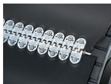
mechanické spony Flexco Bolt Hinged